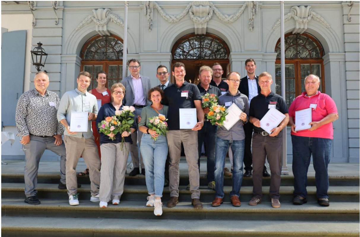
Die Finalistinnen und Finalisten der Staatsweinkürung 2026 erhielten ihre Diplome feierlich im Schloss Ebenrain.

Rotweine: Pinot & Dorsa Barrique, 2023, AOC Basel-Landschaft, Buser Hof Leimen, Buus